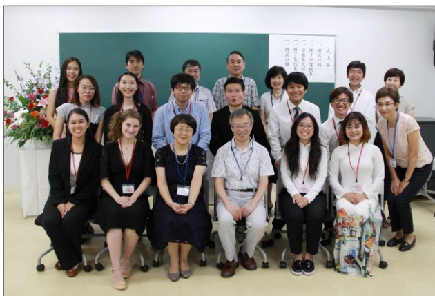
日本語・日本文化研修留学生修了式

日研生からの近況報告や、教員からのメッセージを載せたニュースレター『日研生 E-だより』を年1回発行し、これまでの日研生全員にメール送付している。また、日本語・日本文化学類ホームページやSNSを利用し、情報発信や交流を図っている。