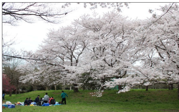
自然豊かなキャンパスが魅力

つくば市は、東京の北東60km、新東京国際空港のある成田の北西40km、北に筑波山（標高877m）を仰ぎ、東に霞ヶ浦をのぞむ自然環境の豊かな地域に位置している。この中に筑波研究学園都市がある。国の試験研究機関・大学を中心とし、民間の研究・教育機関等を加え、国の施策により総合的・組織的な研究学園都市として作られている。また、筑波研究学園都市と東京都心はつくばエクスプレスで結ばれ、最短45分で行き来できる。