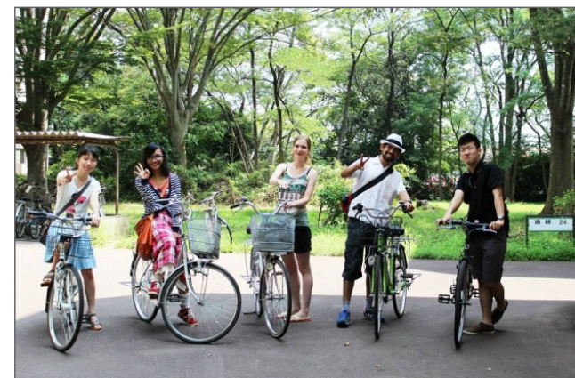
日本人チューターとキャンパス内をサイクリング