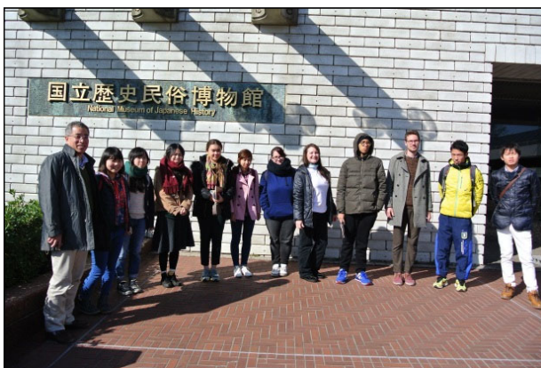
日本語・日本文化実験実習（国立歴史民俗博物館）

(Ⅱ)と(Ⅳ)の科目は、日本人学生が履修する正規科目なので、これらの科目を履修することで、日本人学生との共修・協働の機会が得られる。例えば、「日本語・日本文化共同研究(Ⅰ～Ⅲ)」では、日本語、日本文化に関する様々なトピックについて、日本人学生と留学生とが協働で、調査、発表、討論を行う。