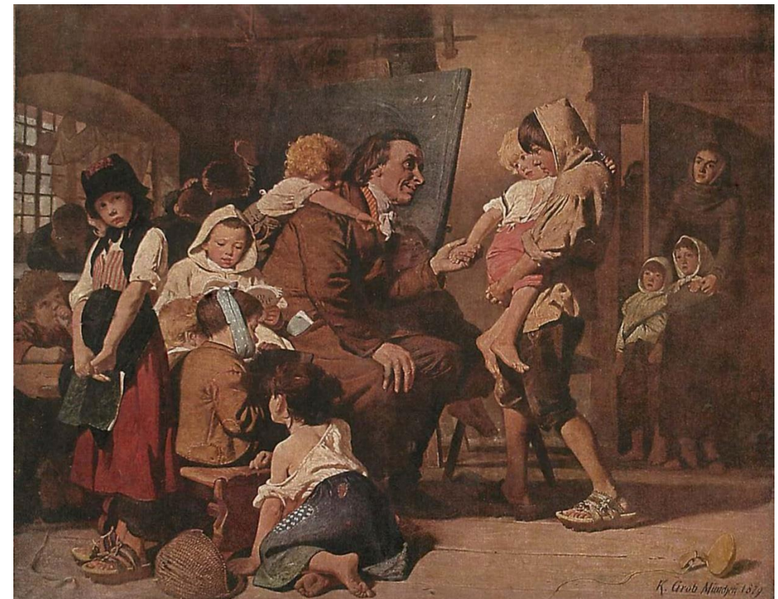
Konrad Grob - Pestalozzi bei den Waisenkindern in Stans.